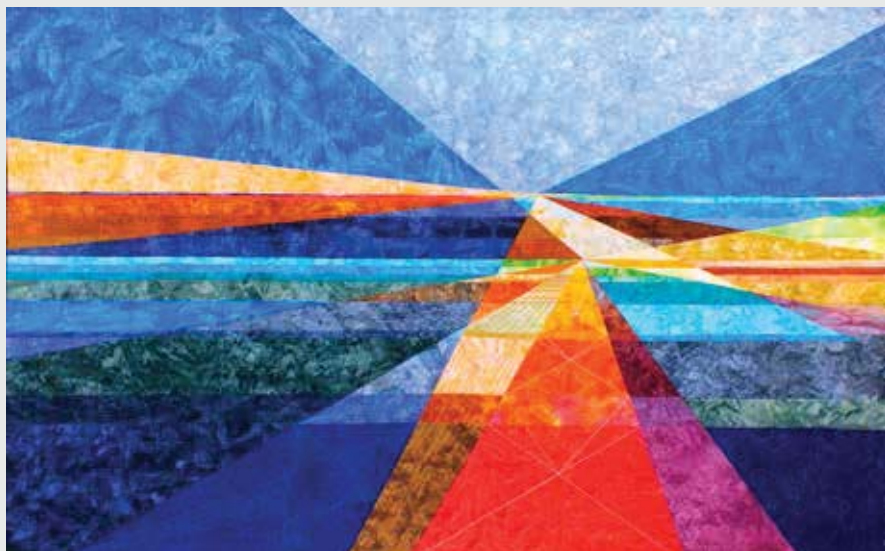
Aig Astar (Journeying). Bestilt til kapel i Aberdeen Royal Children's Hospital. Aig Astar (på vej) repræsenterer de mange stier og valg, der er åbne for os gennem hele livet. Vi kan blive mere bevidste om forbindelser mellem disse stier. Uanset hvilken vej vi vælger, vil det i sidste ende føre os derhen, hvor vi ønsker at være.