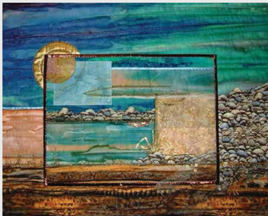
The Auld Rock. Abstrakt billede af Shetlandsøerne.